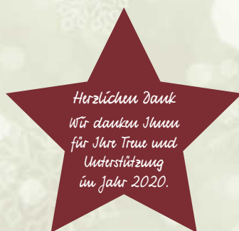
Symbol_001 mit Text_007