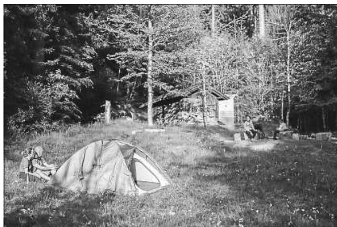
Die Trekking-Camps verfügen auch über eine Feuerstelle und ein Toilettenhäuschen.