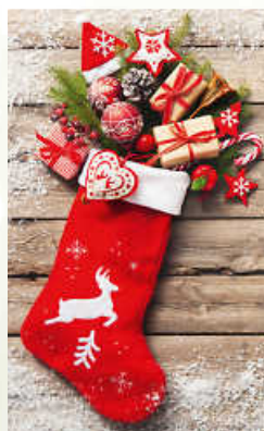
WA20_007: 2-spaltig, 90 x 60 mm