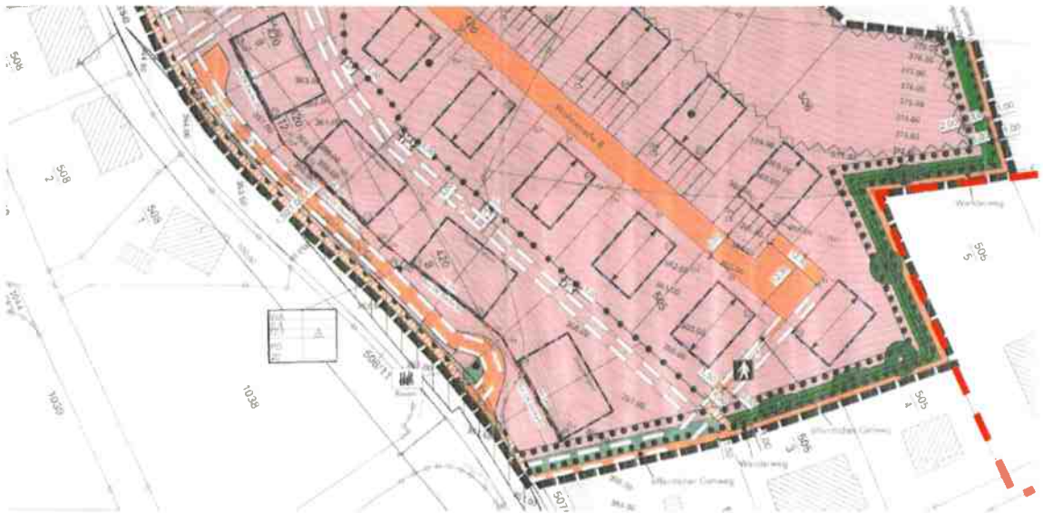
Angrenzender Bebauungsplan „Stadtwäldele“ (06.05.1998) mit Darstellung des Geltungsbereichs des nun vorliegenden Bebauungsplans (rot umrandet) (nicht genordet, ohne Maßstab)

Im Osten sowie im Norden schließt der rechtswirksame Bebauungsplan „Stadtwäldele“ (in Kraft getreten am 06.05.1998) an den Geltungsbereich an. Dieser setzt für die angrenzenden Flächen ein allgemeines Wohngebiet, eine Fläche für Maßnahmen zum Schutz, zur Pflege und zur Entwicklung von Landschaft, sowie einen Wanderweg fest.