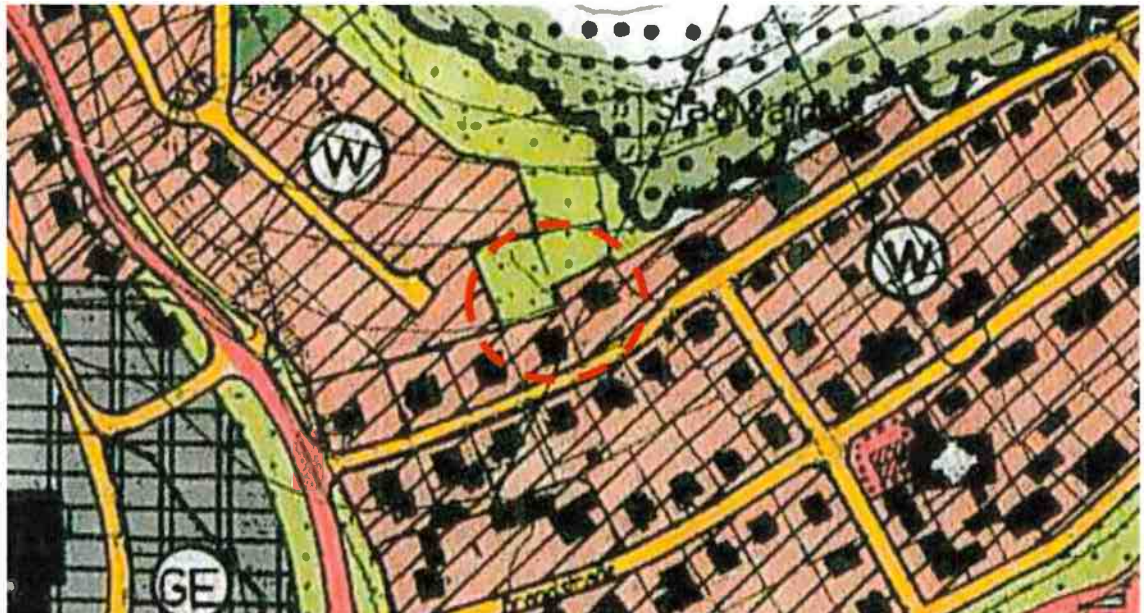
Ausschnitt aus dem Flächennutzungsplan des Gemeindeverwaltungsverbandes Elzach (genordet, ohne Maßstab) mit Darstellung des Plangebiets (rot umrandet)