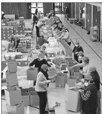
Die Packstraße aus der Drohneperspektive

Mit 1050 Paketen, prall gefüllt mit Grundnahrungsmitteln wie z.B. Öl, Mehl, Zucker, Reis, Teigwaren oder Konserven übertraf sich das Team um die Hilfemacher am 1. Advent selbst.