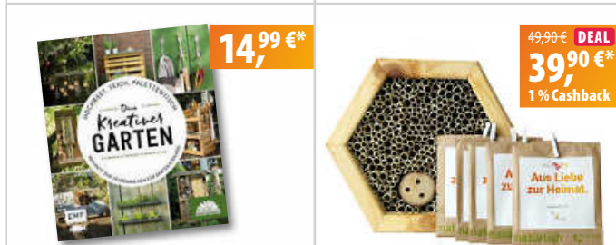
Edition Michael Fischer Dein kreativer Garten