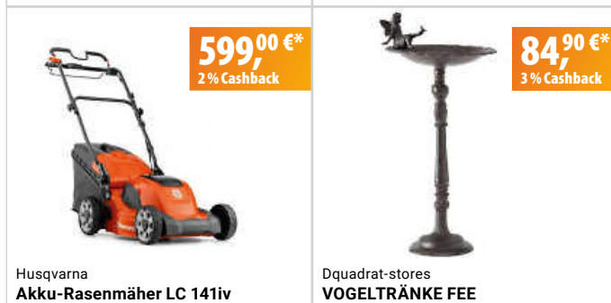
Husqvarna Akku-Rasenmäher LC 141iv