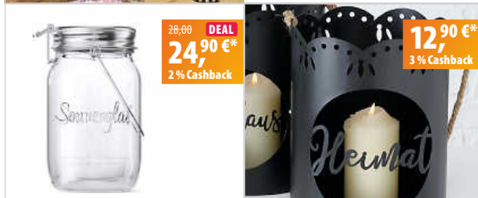
Sonnenglas SONNENGLAS® Mini