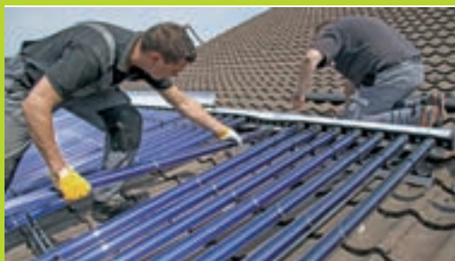
Eine Solarthermieanlage auf dem Dach ist eine gute Ergänzung zur Ölheizung.

Eine thermische Solaranlage kann die Heizung zwar nicht ersetzen, sie aber sinnvoll ergänzen. Im Sommer können Sonnenkollektoren auf dem eigenen Dach den gesamten Bedarf an warmem Wasser decken. Auch in den Übergangszeiten helfen diese dabei, den Brennstoffbedarf zu verringern. Steht nicht ausreichend Sonnenenergie zur Verfügung, liefert die Ölheizung jederzeit so viel Wärme, wie benötigt wird. Damit die Kombination verschiedener Energieträger, also eine Hybridheizung, funktioniert, wird zudem ein Wärmespeicher benötigt.