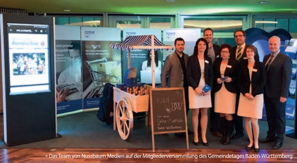
» Das Team von Nussbaum Medien auf der Mitgliederversammlung des Gemeindetages Baden-Württemberg